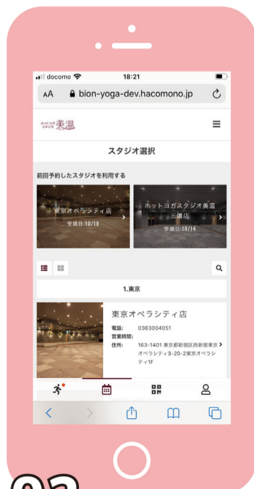
02 予約サイトに登録