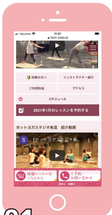
01 レッスン予約をクリック